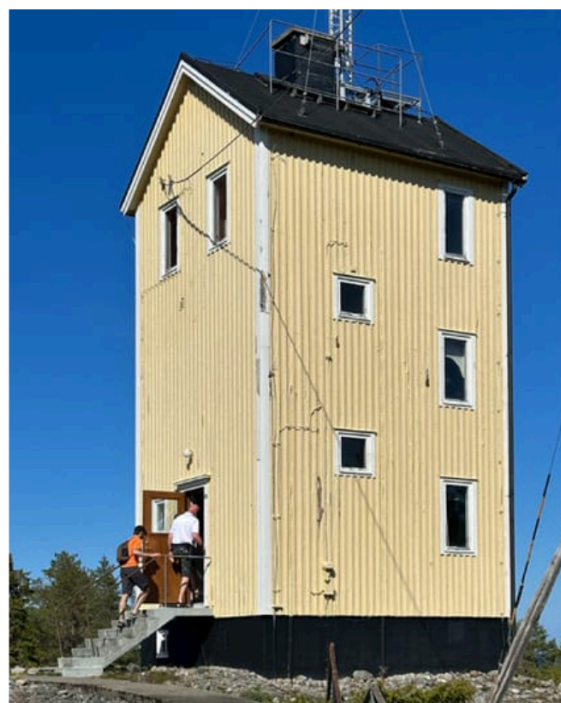
Fyrvaktarbostad i Rataskär, del av forskningsprojektet "Små grejer".