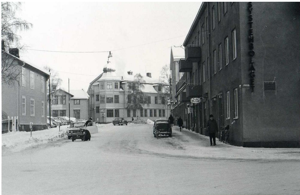
Foto 1960-tal. (Pågående byggverksamhet förhindrar att aktuellt foto från södra änden av Götgatan.)

synas mot himlen ovanför taket på Arken 10. Där de på så sätt kommer att underminera och försvaga tornhusets avsett dominerande roll.