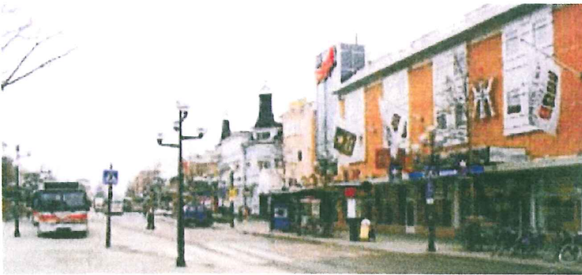
Vasaplans södra sida.

När några avrivna kvarter gav utrymme för en breddning av Skolgatan kunde denna helt nya plats för kollektivtrafik skapas i hjärtat av stan. Genom flyttning av Moritzska gården (se 23!) kunde också det nya stadsbiblioteket lokaliseras hit och med även ett nytt Folkets Hus på plats, skapades optimala förutsättningar för en attraktiv mötesplats.