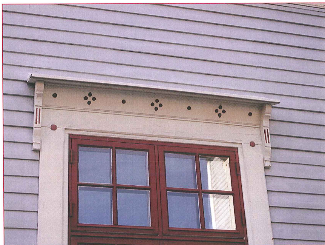
De utborrade och utskurna dekorationerna har ursprungligen varit målade i avvikande färg, som här på ett hus i kv Matrosen intill Stadshuset.