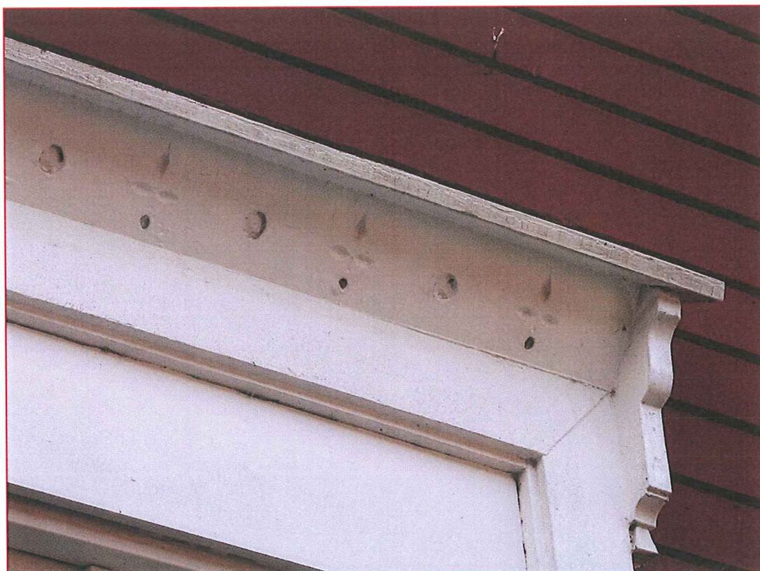
Detalj av dekorativt fönsteröverstycke. Dekoren är idag övermålad med vit färg.