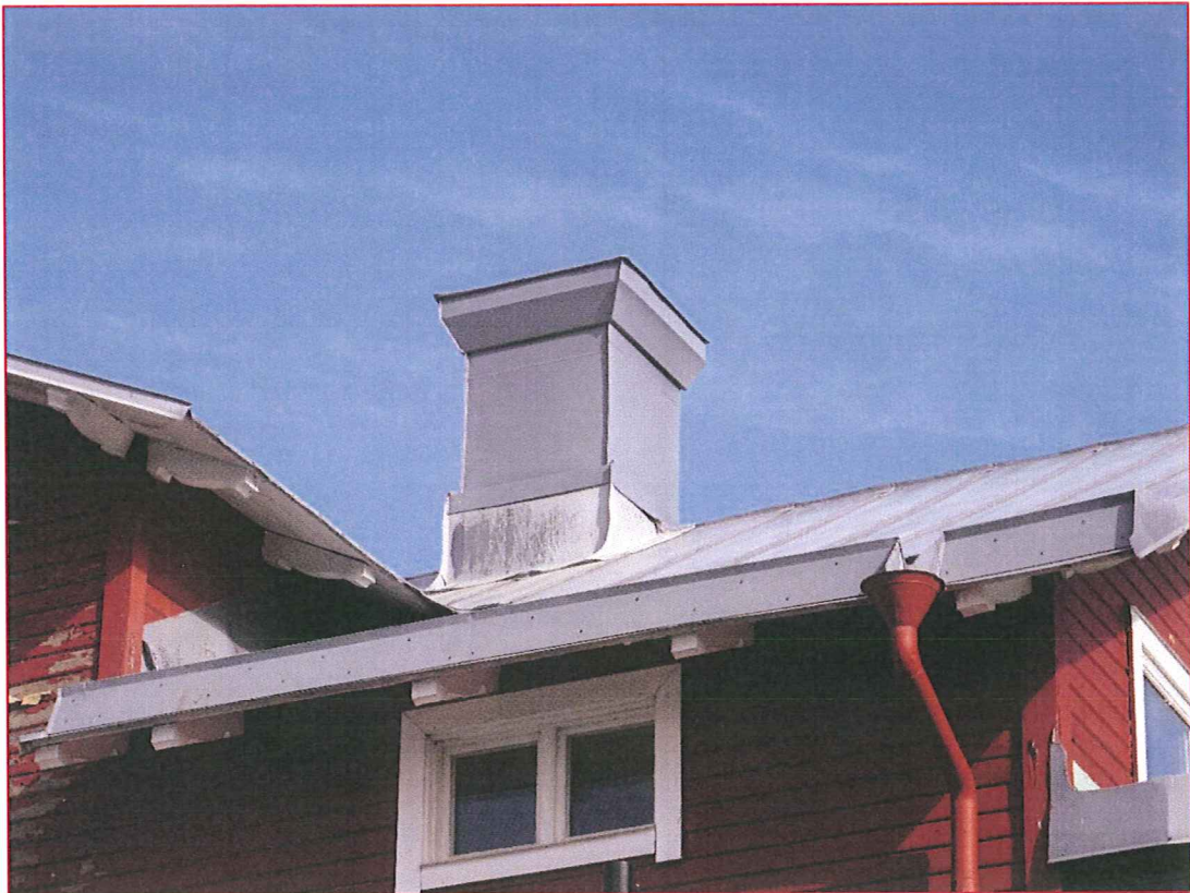
Tegel i skorstenar återvänds om möjligt. Trappade krön återskapas och endast nedre delen av skorstenarna plåtkläs.