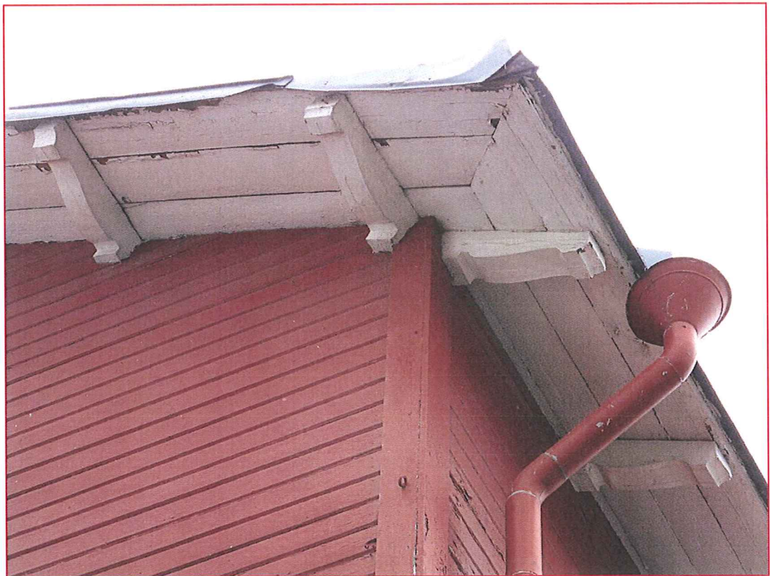
Ett antal taktassar demonteras och återanvänds.