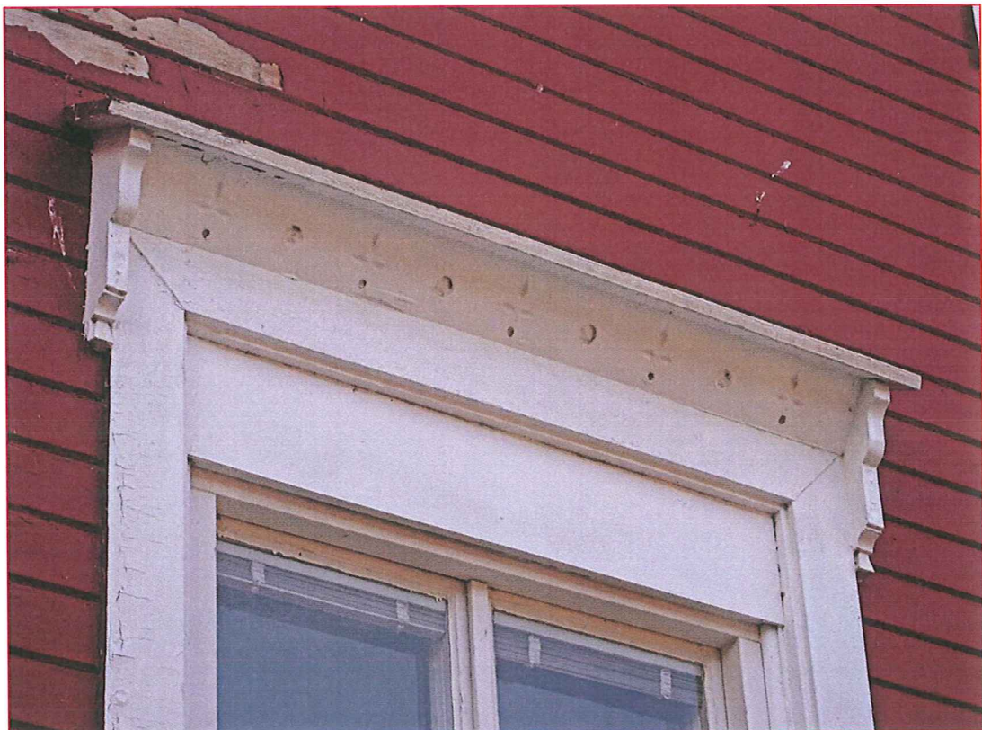
Fönsteröverstycken demonteras och återvänds i lämplig omfattning.