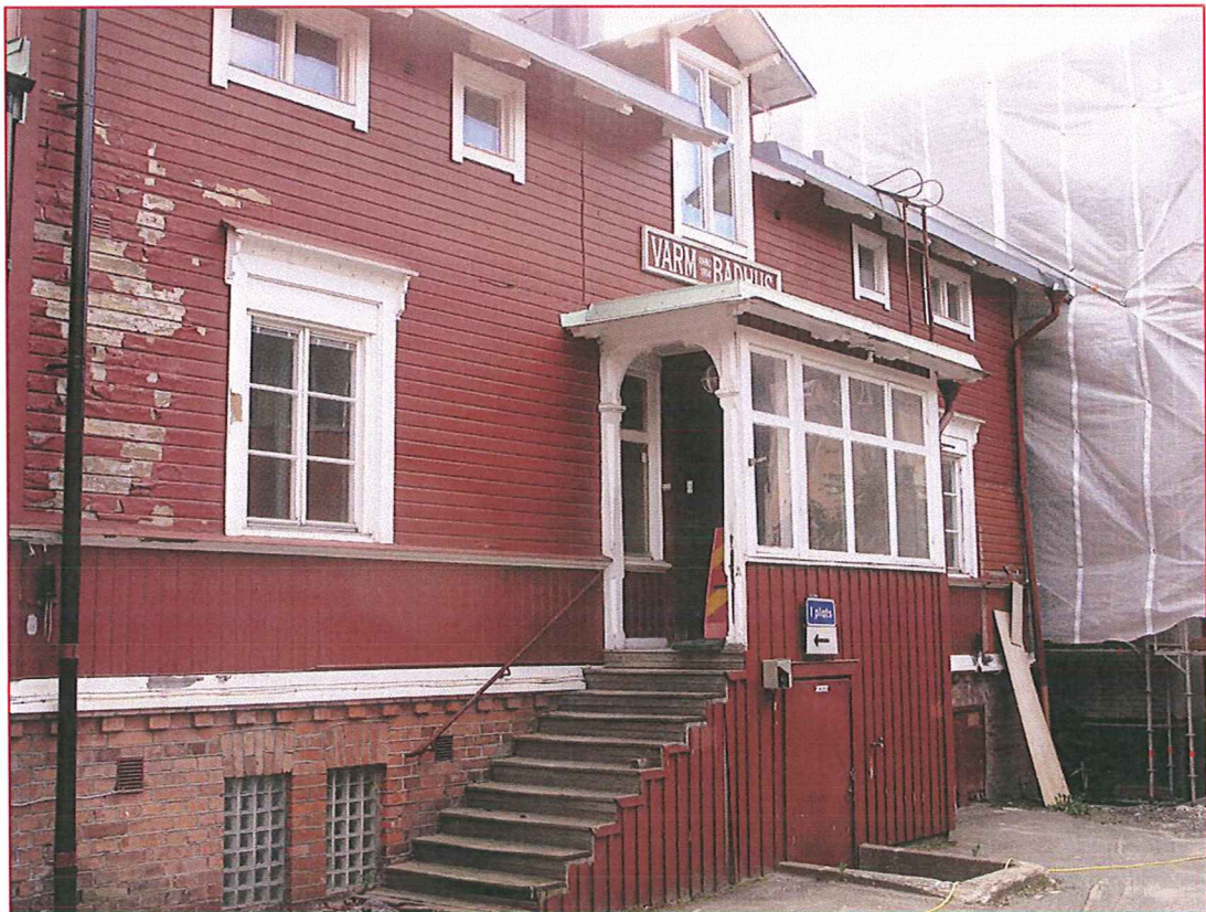
Fasad mot gården. Befintligt utseende. Sockelvåningen bevaras och restaureras till ursprungligt utseende. Verandan kommer inte att återanvändas.